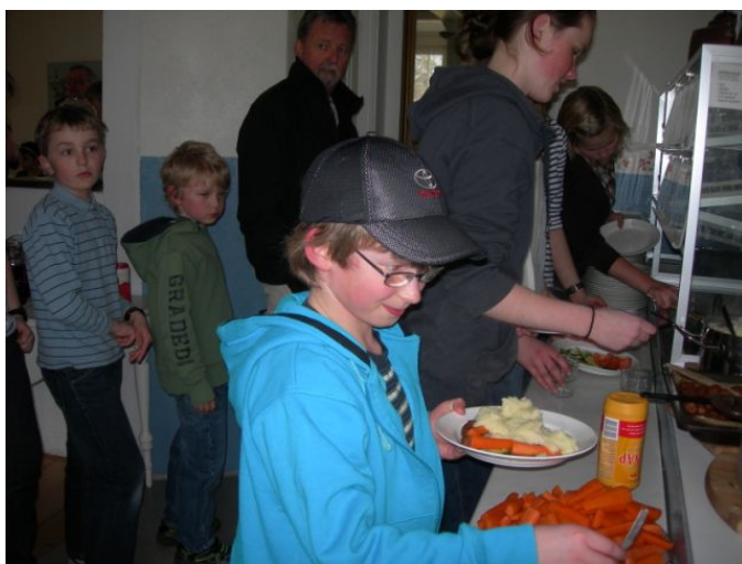
Här intas en av gourmetmåltiderna...