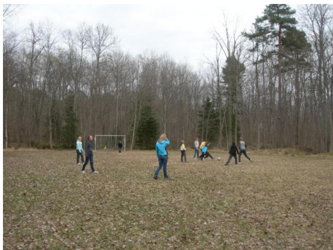
Fotboll sysselsatte de äldre ungdomarna sig med.