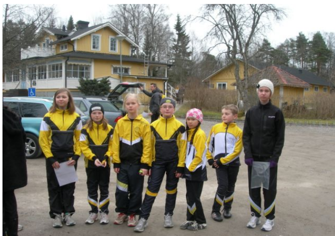
En del av de som tränade i salaterrängen på lördagen.