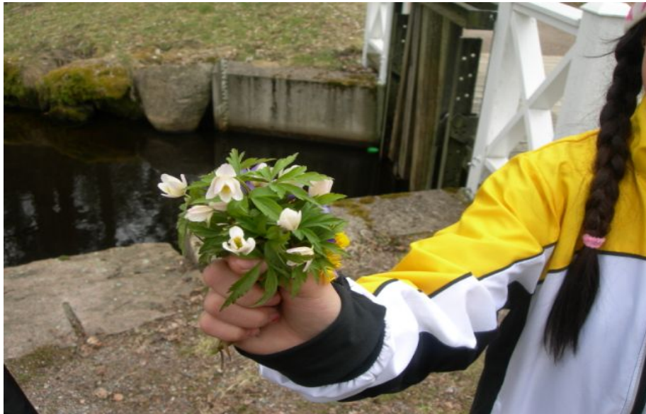
My har hittat några vackra vårblommor som lyste upp i det mulna vädret.