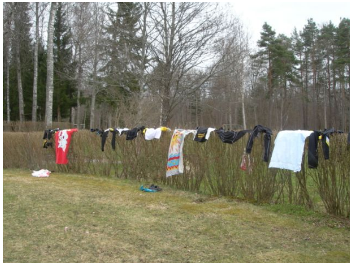
En ny form av häckgödsling??